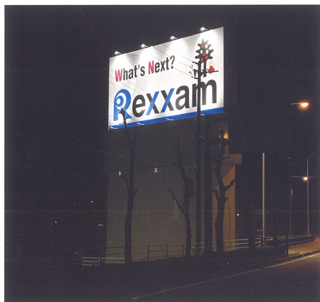
北側 ニュートンとコロンブス(ライトアップ)