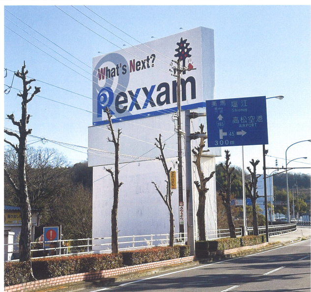
北側 ニュートンとコロンブス(昼間)